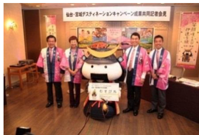
仙台・宮城デスティネーションキャンペーン

キャンペーンを盛り上げるため、中心部商店街にフラッグ及び横断幕の掲出を行いました。