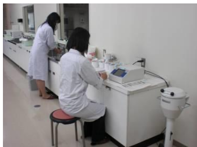
学校給食センターでの放射性物質検査の様子

https://www.city.sendai.jp/kyushokune/kurashi/manabu/kyoiku/inkai/kanren/kyushoku/kyushoku/kekka.html