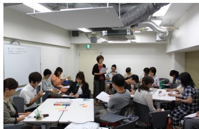
とうほくあきんどでざいん塾ワークショップ