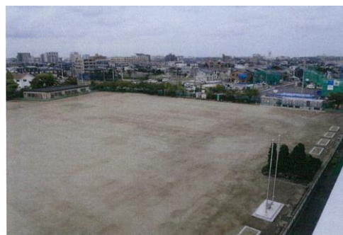
復旧整備後の蒲町小学校の校庭