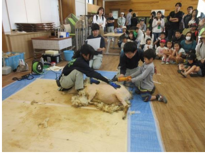
ヒツジの毛刈り公開