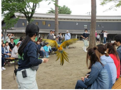
オウム・インコの日