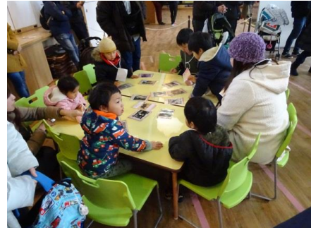
正月開園(カルタ大会)