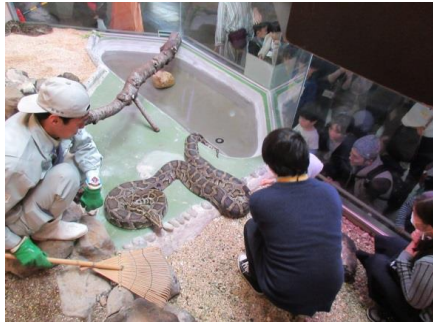
動物公園 うらがわたんけん隊