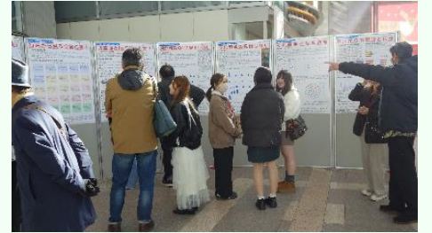
宮城学院女子大学 アエルでの展示の様子（令和7年11月）

終戦80年の令和7年度に宮城学院女子大学で心理学を学ぶ1年生が仙台空襲と向き合いました。当時の新聞や雑誌記事の見出しをデータベース化して分析し、空襲の背景や防空壕、終戦後の仙台的復興について考察を加えました。