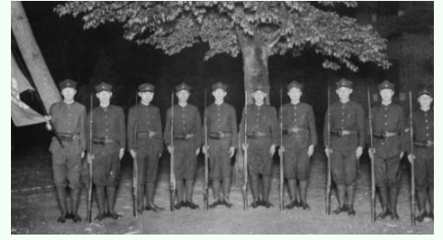
軍事教練（昭和14年頃）

東北大学史料館では、戦禍の中で生きた学生たちの記録を基に、戦争に関わる調査研究の展示を行います。新たな資料紹介を加え、大学の戦時と戦後について考えたいと思います。