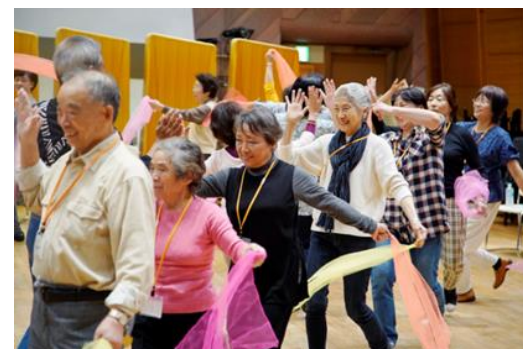
50歳以上対象「Shall we シング？」