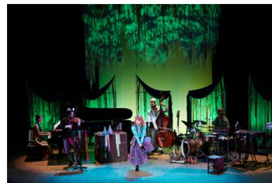
ワークショップ・コンサート 「バーバラの魔法のくすり」