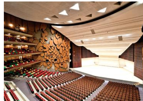
コンサートホール形式