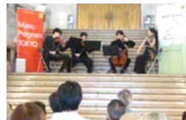
東京国立博物館大階段