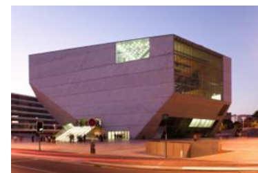
カーサ・ダ・ムジカ