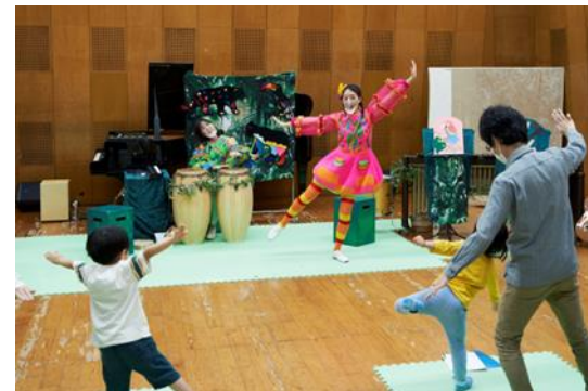
東京文化会館ミュージックワークショップ 「ココとペペのわくわくカーニバル」