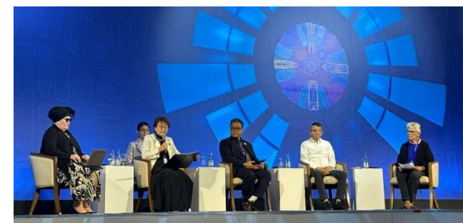
▲2024年アジア太平洋防災閣僚級会議(フィリピン・マニラ) 10月14日~18日、全体会合やイベント、展示等を実施(最終日は現地視察のみ)