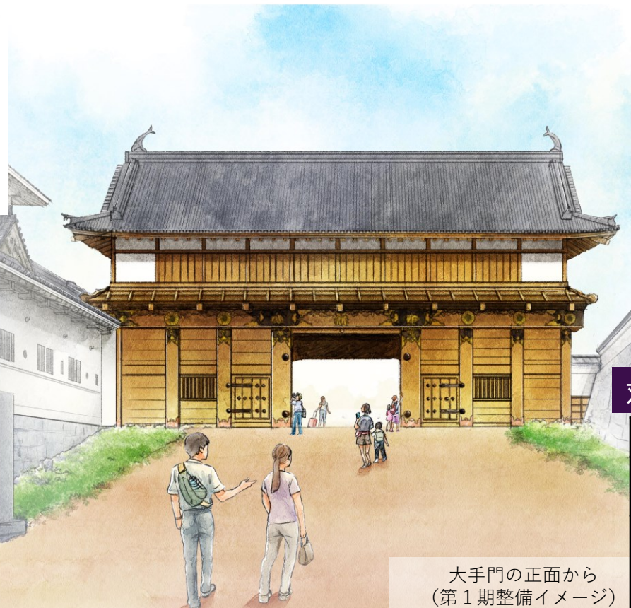
大手門の正面から (第1期整備イメージ)