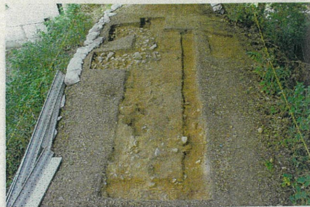
写真5 三の丸土塁2区の様子(東から)

また、2区の場所は、江戸時代の絵図で土塀の表現は見られる場所ですが、調査で土塀の痕跡が見つからないことは、三の丸東側の土塁が江戸時代に何度も修理(表1)される中で撤去された可能性を示していると考えられます。