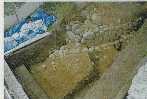
写真1 調査区東側の様子(北東から)

また、調査では熱で変形したガラスが多く出土しました。出土したガラスは、ほとんどがビール瓶や一升瓶で、周辺に捨てられていたものが、翼門が焼失した1945年の仙台空襲で溶けた可能性があります。変形したガラスは調査区の表層に厚く堆積する層から出土したので、戦後に調査区周辺で大規模な造成が行われた可能性があります。