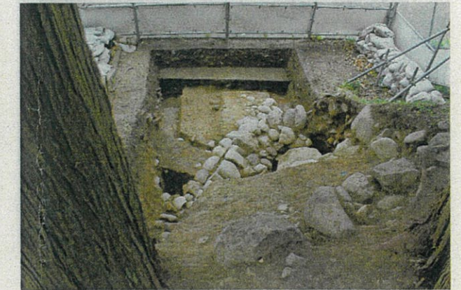
写真2 調査区全景(西から)