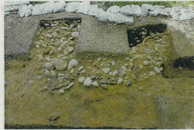
写真6 2区で見つかった集石(北から)

写真手前側は、明治時代以降の掘削でいくつも穴が開き、盛土の上面がでこぼこしている。