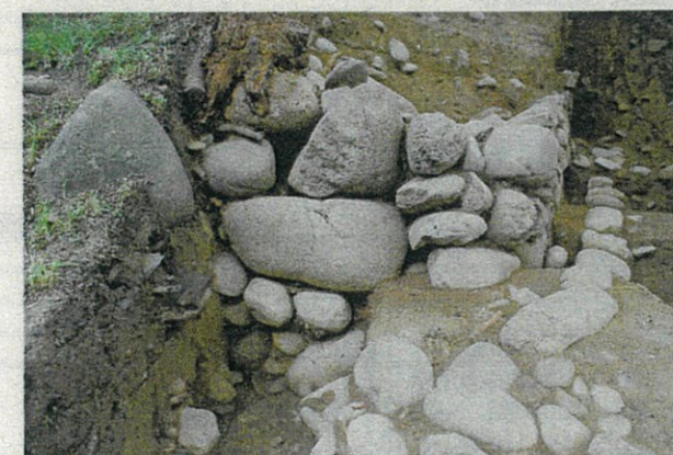
写真3 北に延びる石垣の様子(東から)