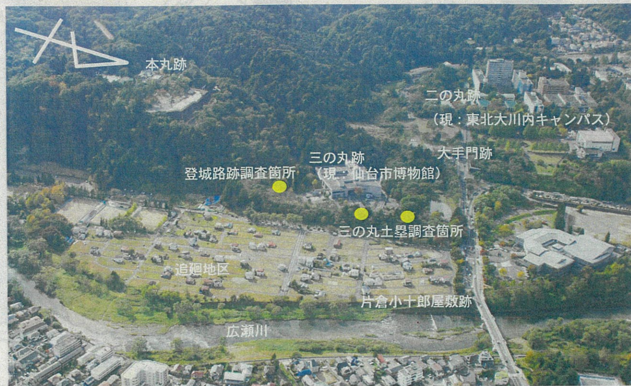
図1 仙台城跡空撮写真 (東から撮影)

仙台城跡の整備に向けて、7月から翼門跡周辺の登城路跡と三の丸土塁で発掘調査を実施しています。登城路跡の調査は今回が3回目で、これまでに清水門から本丸詰門へ向かう登城路跡周辺の発掘調査や石垣の測量を行ってきました。今回の調査は、翼門跡周辺における登城路の位置と遺構の確認を目的に、特に、翼門跡西側の石垣が本来の登城路に沿ってどのように延びているのかを明らかにするために行いました。土塁の調査は、これまで三の丸東側の土塁を中心に行い、今回で5回目になります。今回の調査は江戸時代の土塁形状と塀などの痕跡を確認するため、三の丸東側土塁に2か所の調査区を設定しました。特に、三の丸東側土塁の北端の調査区は、絵図で土塀の表現が見られる場所です。