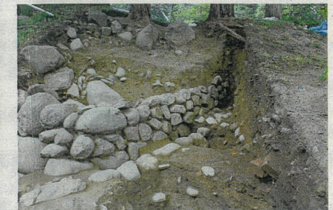
写真4 北西に延びる石垣の様子(東から)