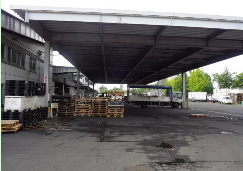
水産物買荷保管積込所