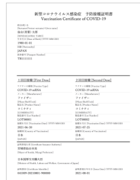
(Mẫu giấy chứng nhận dự kiến)