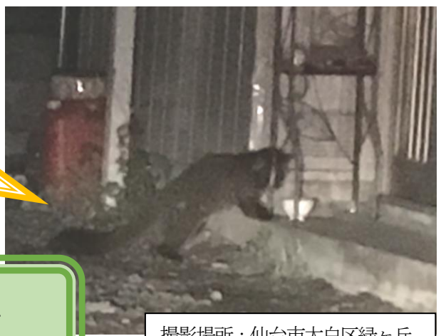
撮影場所：仙台市太白区緑ヶ丘

玄関先に置かれた猫の餌を食べにきている ハクビシン！ 町の中でもこんな光景が！ それは良いこと？困ったこと？