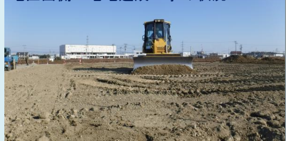
地区西側：宅地造成工事の状況

交通規制等でご迷惑をお掛けしておりますが、安全第一で作業を進めてまいりますので、引き続きご理解ご協力をお願いいたします。