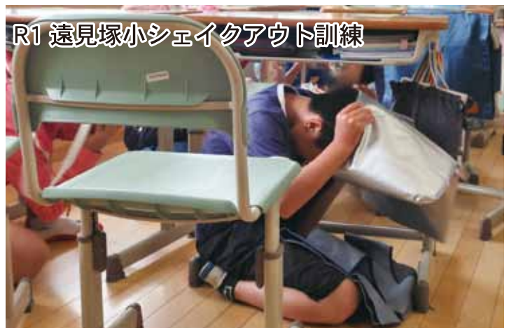
R1 遠見塚小シェイクアウト訓練

また、訓練終了後は、災害時の備えとして「家具の転倒防止対策」や「食料等の備蓄」を確認しましょう。