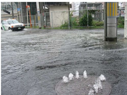
平成 21 年 10 月 8 日