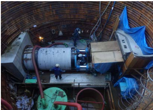
平成 27 年 11 月 増補管工事