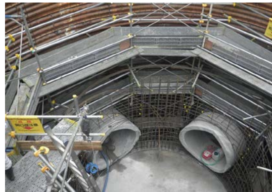
平成 26 年度 増補管工事