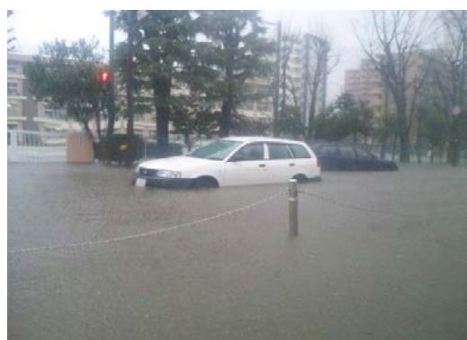
平成22年12月24日 榴岡小学校前