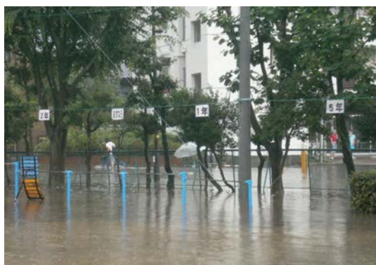
平成21年7月26日 榴岡小学校