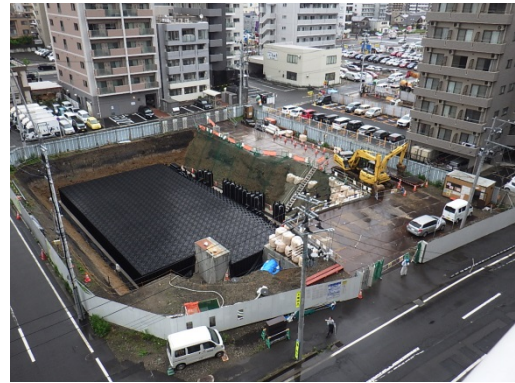
平成 29 年度 榴岡第 2 雨水調整池（公園予定地内）