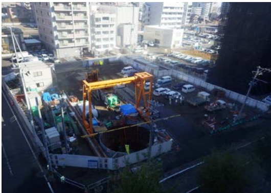
平成 27 年 11 月 増補管工事