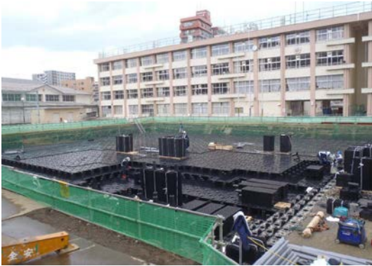
平成 24 年度 榴岡第 1 雨水調整池（榴岡小学校内）