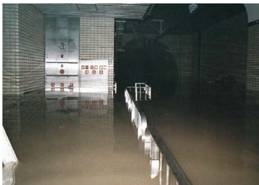
昭和61年8月5日 地下鉄駅構内（長町南駅）