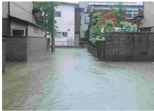
平成14年7月11日 長町南一丁目