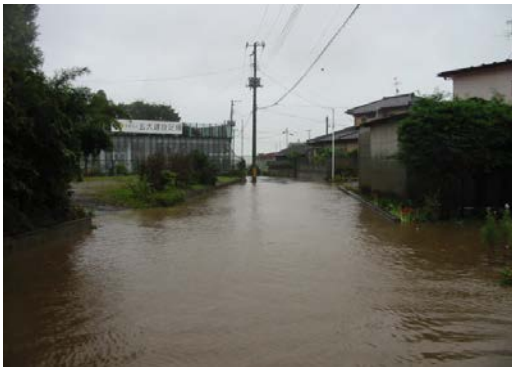
平成 18 年 9 月 28 日 四郎丸