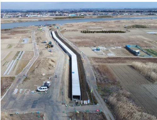
平成 31 年 2 月 放流渠工事（河川堤防方向より）