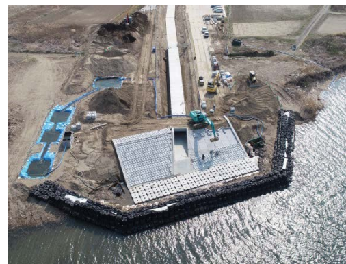
平成 31 年 4 月 放流渠工事（名取川方向より）