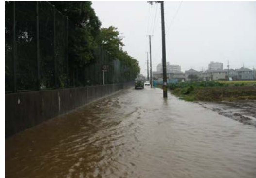
平成 18 年 9 月 28 日 四郎丸