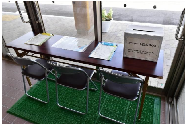
アンケート結果 (77 枚)

年間を通じてクラブハウス内にアンケート記入スペースを設置し、受付の際等記入を呼びかけている。