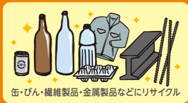
缶・びん・繊維製品・金属製品などにリサイクル