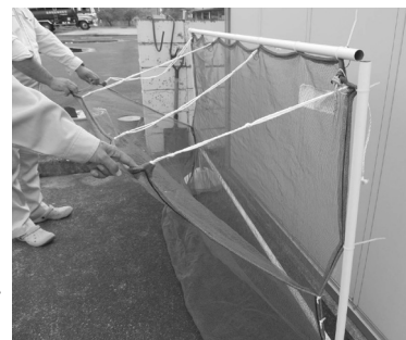
▲ハンサムネットは、集積所の状況に合わせて、形状を工夫しています

ハンサムネットについて詳しくは、お住まいの区の環境事業所にお問い合わせください。