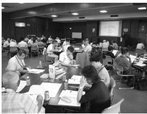
▲ワークショップ形式での研修会