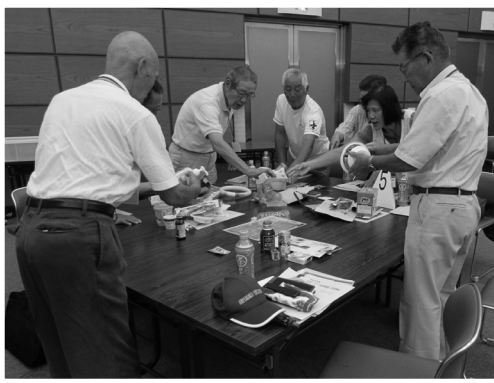
▲ごみ分別体験研修会

推進員活動を行うに当たって有益な知識や手法を身に付けていただくため、さまざまなテーマ・形式で研修会を開催しています。推進員同士の交流や情報交換を図る場にもなりますので、ぜひご参加ください。(適宜、ご案内を郵送いたします)