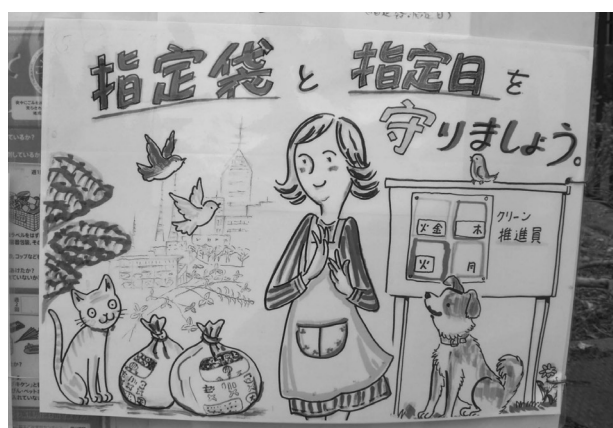
◀集積所掲示用ポスター