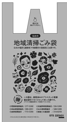
▲地域清掃ごみ袋 サイズは2種類（大と小）あります