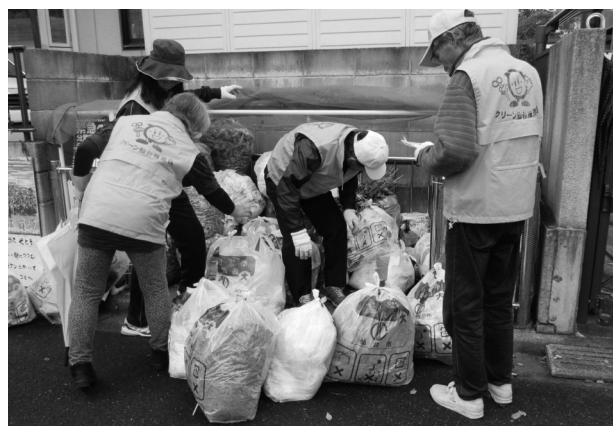
◀調査風景 調査は、袋の外観から目視で行います

自分が住む地域のごみの排出状況を知ることで、問題点を把握し、以後の推進員活動の手掛かりとしていただくことを目的とした調査です。地域の方々にも参加を呼び掛けて一緒にごみの排出状況を確認してもらうことで、出し方マナーの改善につながるほか、推進員やメイトの活動を知ってもらうこともできます。