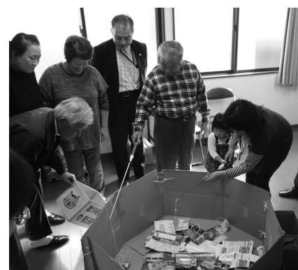
▲出前講座では、ごみの分別をゲーム感覚で楽しく学ぶメニューなども用意しています