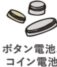
ボタン電池、 コイン電池