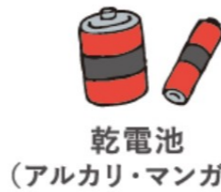
乾電池 (アルカリ・マンガン)