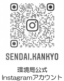
SENDAI.KANKYO 環境局公式 Instagramアカウント