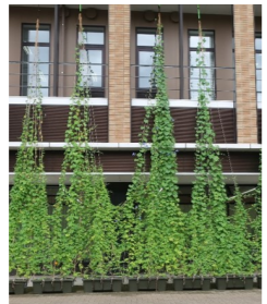
たまきさんサロンでの設置例