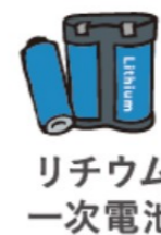
リチウム 一次電池