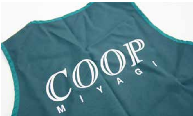
まち美化活動のためにつくられたグリーンのビブス。

生産部にあるミート加工センターやフィッシュ加工センターなど、各センター長やグループのチーフなど10人から15人が参加して、事業所の周辺を30分かけて清掃活動と除草活動を行っています。背中に大きく「COOP」の文字が白抜きされたビブスを身につけ、軍手や火ばさみ、ビニール袋をもって出発。除草担当の人は専用の器具やシャベル、自慢の草刈り機をもちます。終了後は集めたごみを入れた袋の数や重さを計測、記録しています。