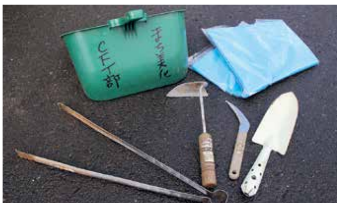
清掃や除草の道具類は、所定のロッカーにきちんと整理して収められています。