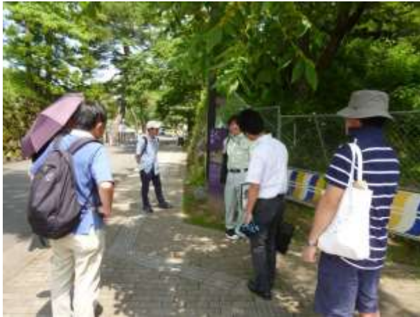
社会教育施設連携研修