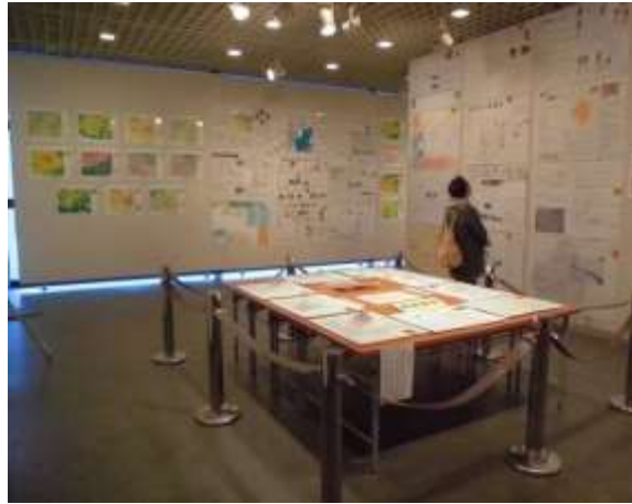
中学校生徒地図作品展