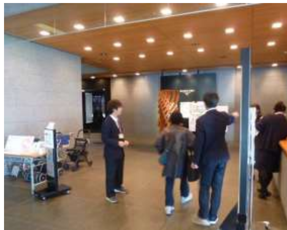
中学生の職場体験実習