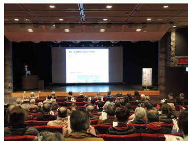
第47回 仙台市史講座