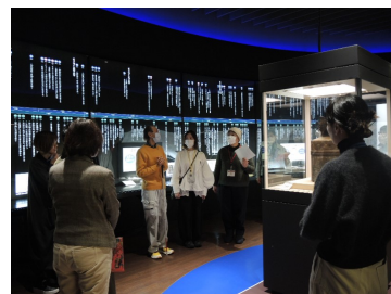
第 2 回 SMMA 研修会