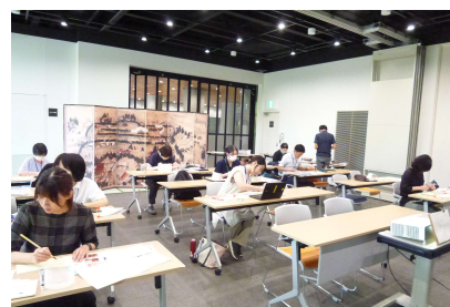
小中学校図工・美術科研修