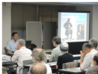
第15回 まちなか博物館講座