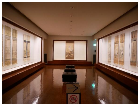
コレクション展示室II