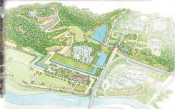
整備全体のイメージ図(本質的価値が顕在化された姿) ※現時点での整備イメージ図であり、今後整備内容を変更する場合があります。