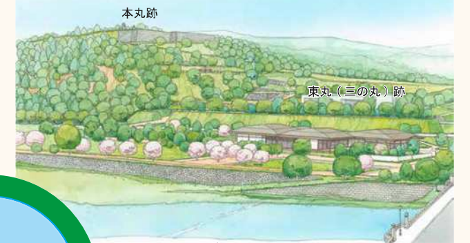
整備イメージ図（広瀬川対岸から）