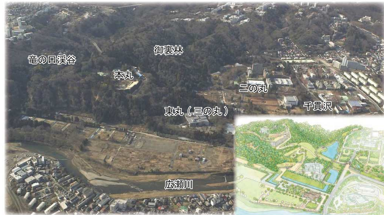
仙台城跡航空写真(2016年撮影)