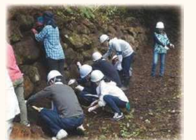
石垣清掃イベントの様子