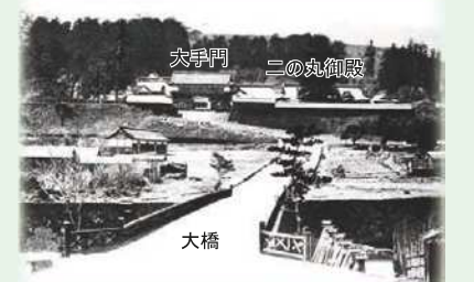
明治初期の二の丸跡

青葉山に抱かれた仙台城跡は、「仙台」発祥の地として、地域と共に歴史を刻んできました。本丸跡からの眺望は来訪者に緑豊かな景観を印象付け、「杜の都」の呼称の普及に大きく貢献しました。