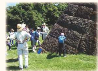
親子石垣見学会の様子

仙台城跡の魅力をより多くの方に知ってもらい、市民や来訪者が楽しみながら史跡の理解を深めることができるよう、出前授業や出前講座、遺跡見学会、各種イベントなどの活用事業を充実させます。 ホームページや刊行物の発行などを通じて、仙台城跡の価値や調査成果を積極的に発信するとともに、石垣清掃イベントの実施など市民協働事業をより一層進めます。