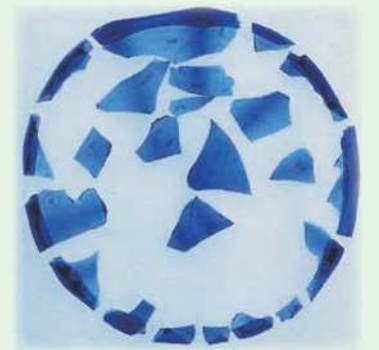
出土遺物(ヨーロッパ産硝子器)