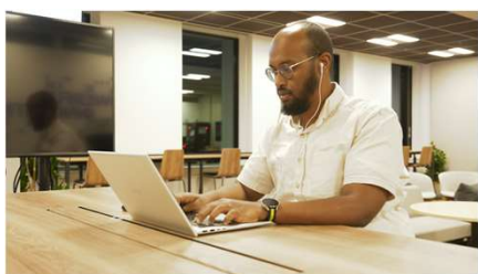
グローバルな人材が アクセントを 支えている。

加えて、外国籍のメンバーが抱える課題についてもサポートいただきました。外国籍の方にとっても非常に働きやすい環境だと思っています。