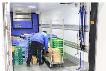
倉庫での作業の様子。 社員とアルバイトが 合わせて50名ほどいて、 3割は女性とのこと。

仙台は東北の要です。東北6県の商圈をカバーするならば、仙台に拠点を構えるのが最適だと実感しています。グループとして空白だった「東北・北海道」エリアの全国ネットワーク化が進み、PR面でも大きな効果を生んでいます。