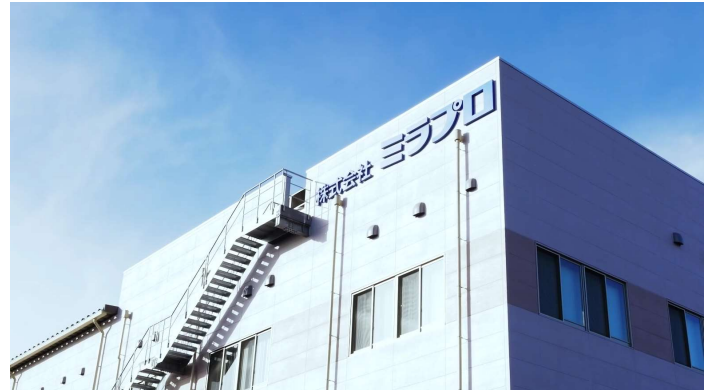
仙台市泉区に立地する宮城工場。