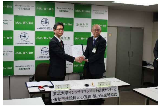
東北大学と仙台市建設局において、社会資本（道路施設）の維持管理に関する連携・協力の協定を締結