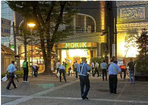
国分町地区安全・安心街づくり推進協議会の夜間パトロールへの参加