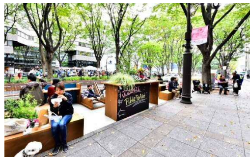
【道路空間の利活用の例】