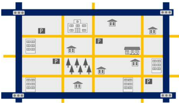
【生活道路のイメージ】

交通事故の被害に遭いやすい子どもや高齢者、障害者をはじめ、市民の安全を確保するため、地域の実情に応じて生活道路の交通安全対策や歩道整備等を進めます。