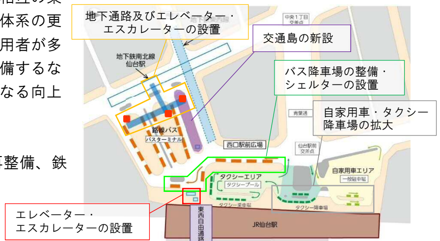
【仙台駅西口駅前広場の再整備事業の概要】