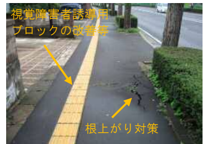
【バリアフリー化の対策箇所の例】