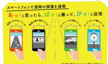
【道路不具合通報システム】