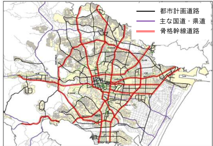
【幹線道路ネットワーク】