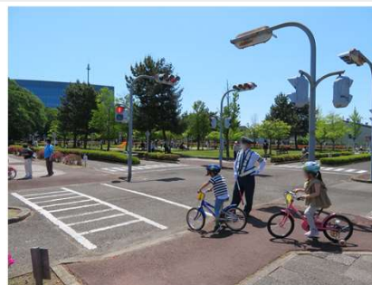
図4 交通公園での交通安全教室の様子 (右)