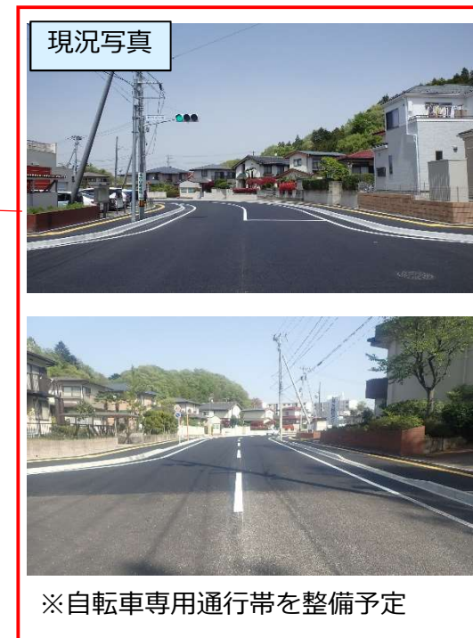
図8 市道 加茂幹線1号線