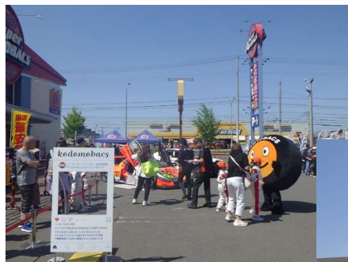
図1 地域や警察等と連携した交通安全啓発の様子