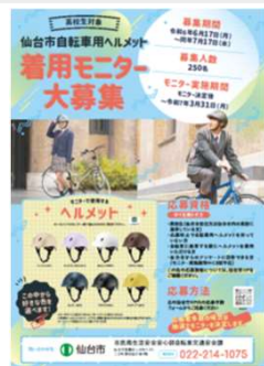
図3 ヘルメットモニター募集ポスター (左)