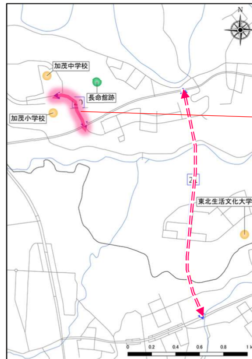
図7 あんしん通行路線（抜粋）