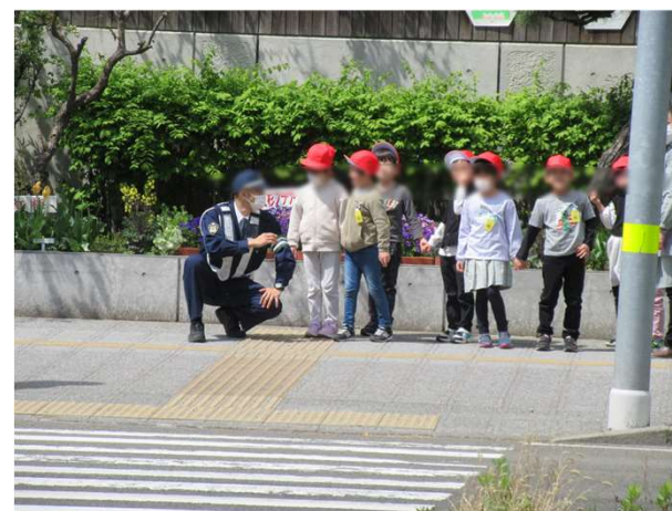
図2 学校や警察と連携した交通安全教室の様子