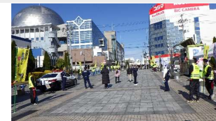
図5 ユアテックスタジアム前街頭啓発