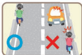
車道は左側を通行