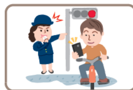
自転車利用中の 危険な行為の禁止 (携帯電話やイヤホンの使用等)