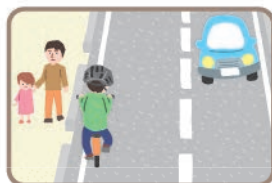
車道通行が原則 (13歳未満などを除く)

保護者は、その監護する未成年者に対して、自転車の安全利用に関する教育を行うよう努めるとしております。次の自転車の交通ルールを守ることに、家庭内で話し合ひましょう。