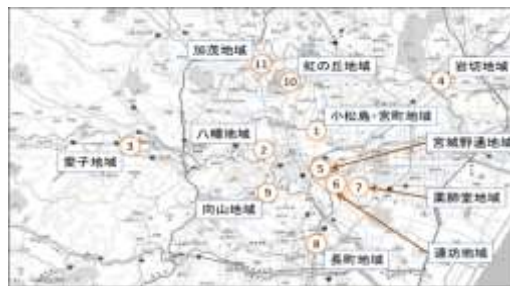
モデル地域位置図 (H25～H28)

仙台市内11か所を自転車安全利用のモデル地域として定め、重点的に自転車の安全利用に関する啓発活動を関係団体と協働して実施。