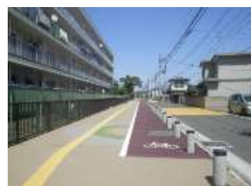
市道大和町1号線の自転車歩行者道内での分離

都心部以外において、「あんしん通行路線」として、優先的に環境整備する路線を選定し、自転車歩行者道内における自転車通行区分を整備。