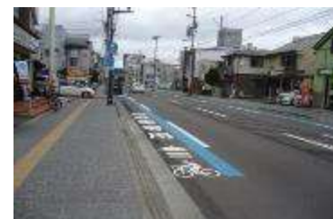
市道宮町通線の自転車専用通行帯

都心部において、「自転車ネットワーク路線」として、優先的に環境整備する路線を選定し、自転車専用通行帯や自転車歩行者道内における自転車通行区分を整備。