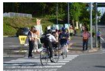
加茂中学校通学路における街頭啓発

モデル地域などで、交通指導隊や地域団体と協働にて街頭における自転車の安全利用の指導や啓発品の配布等を実施。