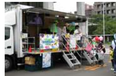
交通安全教育車による交通安全教室

仙台市で主催している「交通フェスタ」等のイベントの機会を利用し、交通安全教育車等による交通安全教室を実施。