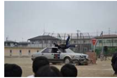
袋原中学校でのスケアード・ストレイト

プロのスタントマンによる体験型の交通安全教室であるスケアード・ストレイト方式による交通安全教室を関係団体と協働により実施。