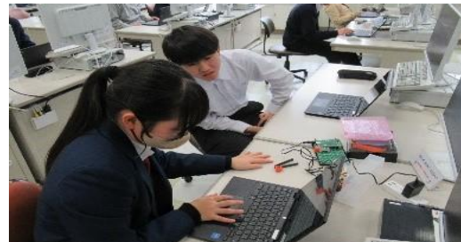
1人1台端末と教材を接続(仙台工業) ICT学習教材と端末を接続したプログラミング学習