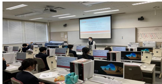
情報処理室での学習(仙台商業) 5室ある情報室で専門科目の学習が行われる(情報処理の授業)