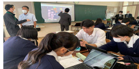
教室での1人1台端末活用(仙台商業) 演示, 板書補助, 調べ学習や意見交換, 情報の共有, プレゼンなど