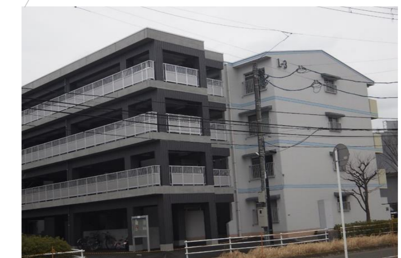
高砂西市営住宅 EV設置工事