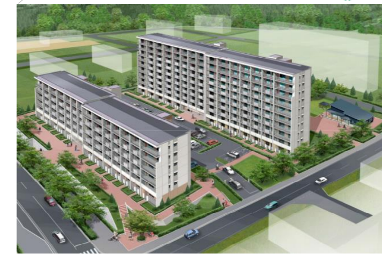
鶴ヶ谷第二市営住宅団地再整備事業