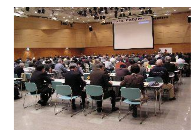
マンション管理基礎セミナー事業