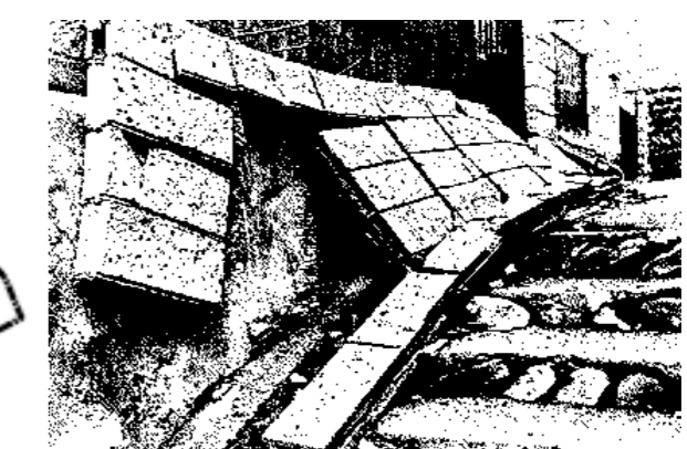
ブロック塀等除却補助事業