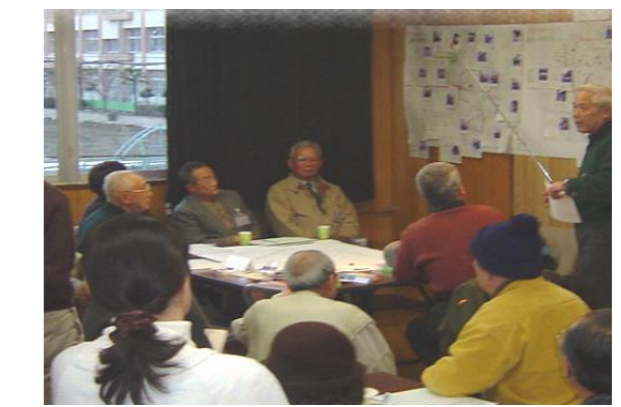
まちづくり支援専門家派遣事業