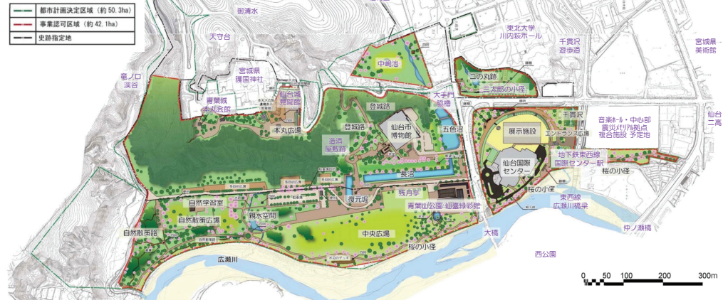
【図1】 青葉山公園整備基本計画図 2013(H25)年3月 ※兼字の名称は記載したもの