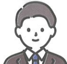
キャリア コンサルタント