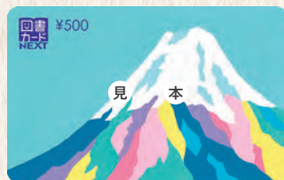
図書カードNEXT(本屋さんなどで本やマンガが買えます)