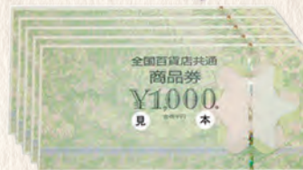
商品券(お店や商品ごとにいろいろな種類があります)