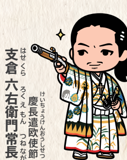
慶長遣欧使節 はせくら るくえもん つねなか 支倉 六右衛門常長