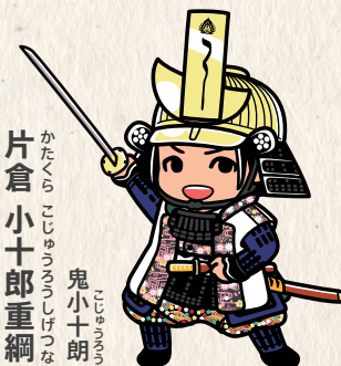
鬼小十郎 かたくら こじゅうろうしげつな 片倉 小十郎重綱