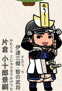
伊達三傑・智の武将 かたくら こじゅうろうかげつな 片倉 小十郎景綱