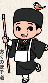
おくのほそ道 まつお ばしやう 松尾 芭蕉