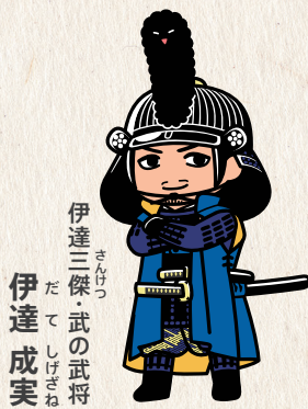
伊達三傑・武の武将 だて しげさね 伊達 成実