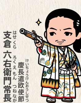
慶長遣欧使節 はせくら るくえもん つねなが 支倉 六右衛門常長