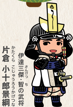
伊達三傑・智の武将 かたくら こじゅうろうかげつな 片倉 小十郎景綱