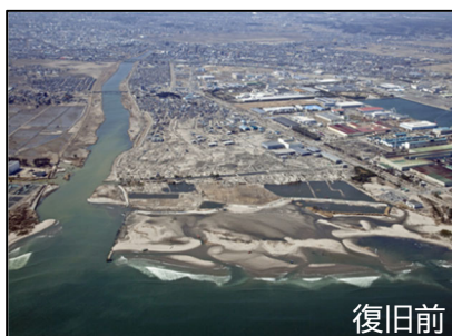
○七北田川（仙台市宮城野区蒲生）