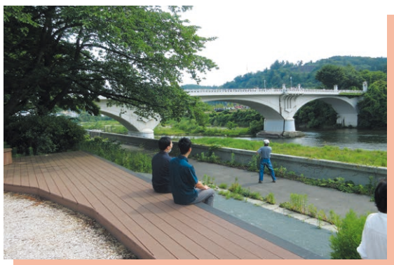
ビューポイント(見る場所)

ビューポイントと見る対象を特定しやすくするために、撮影した写真があればご提供をお願いいたします。