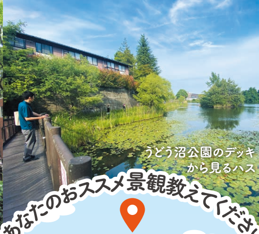
うどう沼公園のデッキから見るハス