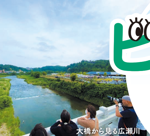
大橋から見る広瀬川