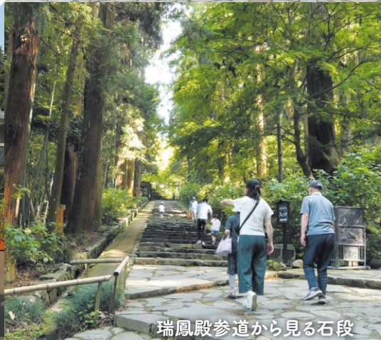
瑞鳳殿参道から見る石段