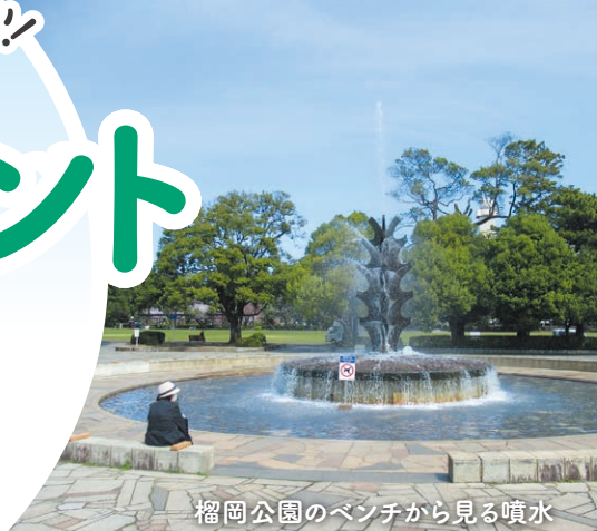
榴岡公園のベンチから見る噴水