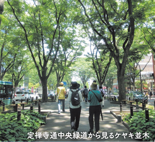
定禅寺通中央緑道から見るケヤキ並木