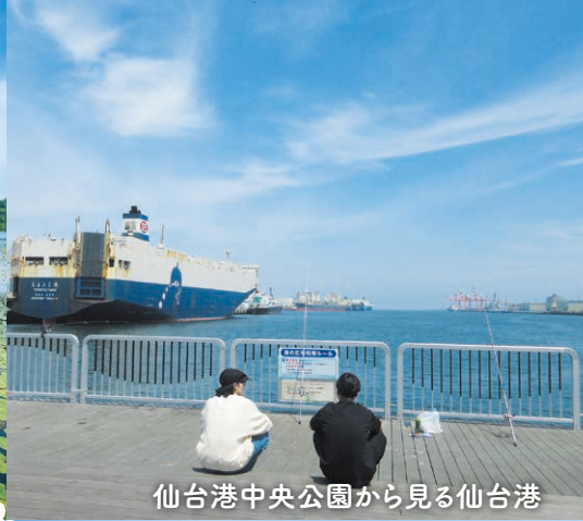
仙台港中央公園から見る仙台港