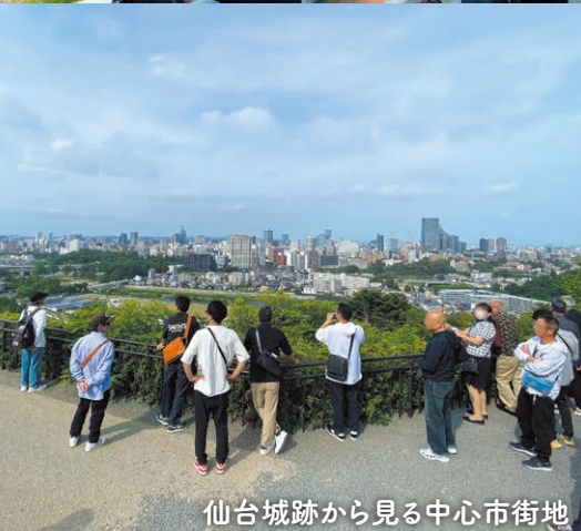
仙台城跡から見る中心市街地