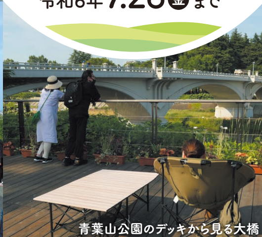
青葉山公園のデッキから見る大橋