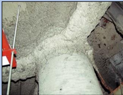
吹付けアスベスト