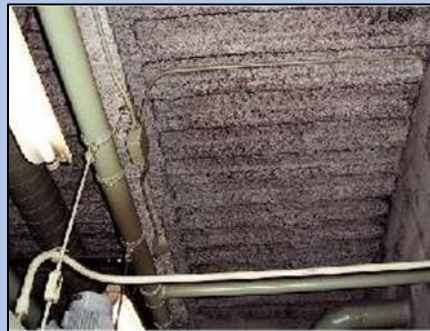
アスベスト含有吹付ロックウール