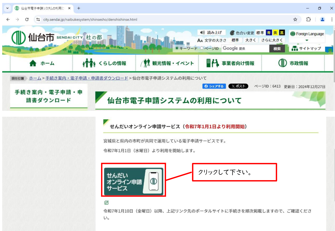
図 3. 「仙台市電子申請システムの利用について」トップ