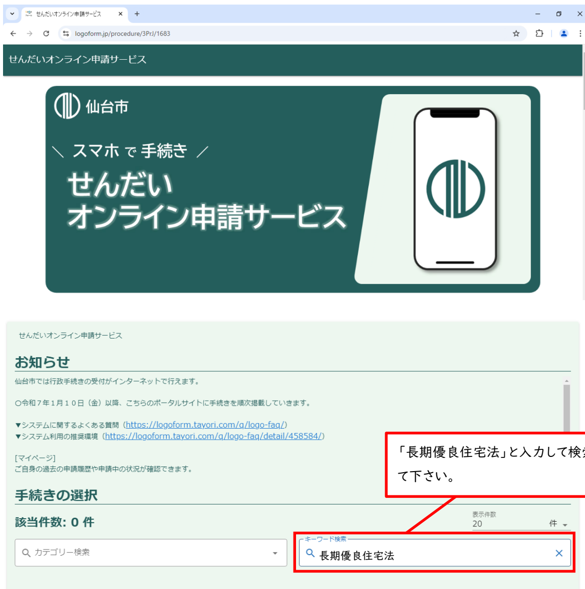
図 4. ポータルサイトトップ