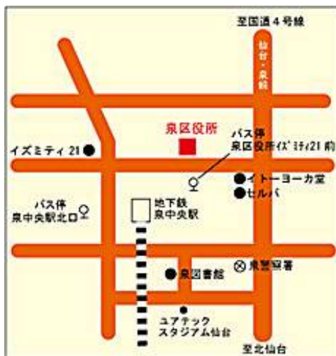
仙台市職員研修所 泉区泉中央二丁目1-1