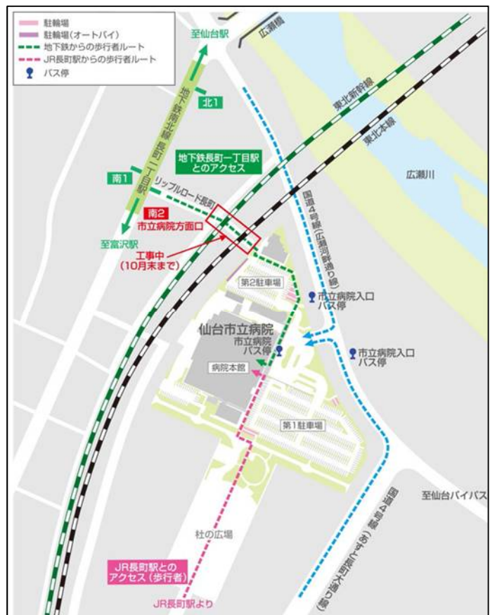
仙台市立病院 太白区あすと長町一丁目1-1