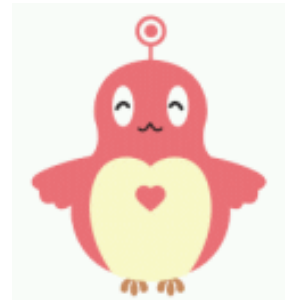
障害理解促進キャラクター「ココロン」

また、仙台市主催のココロン・カフェのほか、障害理解をすすめながら、障害を理由とする差別の解消について考えるため、ココロン・カフェの手法を用いた研修等の開催に協力した。