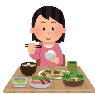
栄養バランスのとれた食事