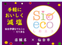
塩ecoプライスレール用POP

減塩商品のスイングPOPやプライスレール用POPがあります。店舗に合わせてご使用ください。