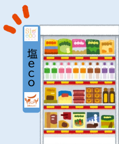
減塩商品コーナーの設置