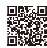
厚生労働省のページへ