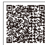
仙台市のページへ