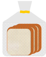
一般的な材料、製法で製造した食パン