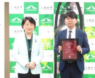
上場達成企業の市長表敬の様子