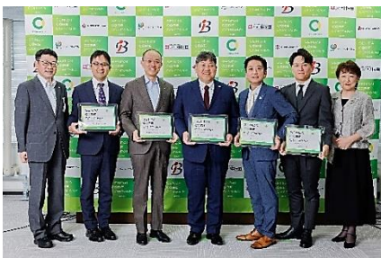
R7選定企業のキックオフセレモニーの様子