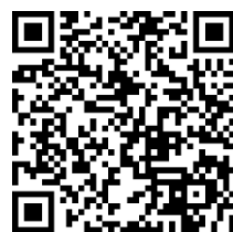
Webサイトの二次元コード