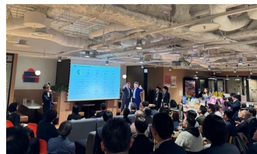
首都圏で開催したビジネスミートアップイベントの様子