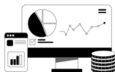
本質的な課題抽出