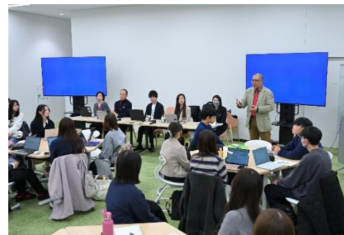
東北学院大学での学生向けイベント