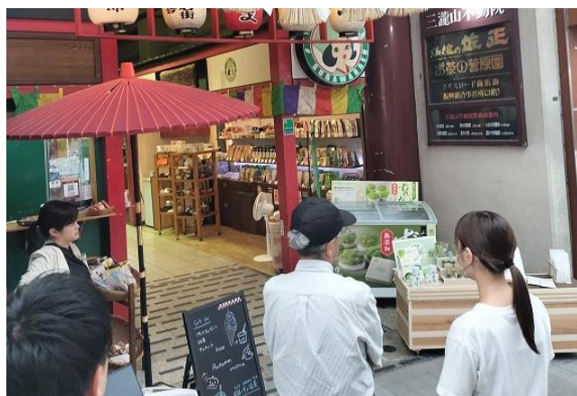
専門家による指導の様子