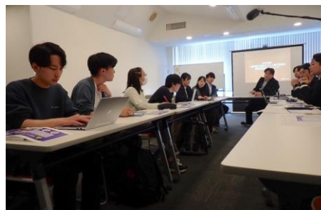
将来のまちづくりに向けた検討の様子 上:他都市事例「岐阜柳ヶ瀬商店街」の研究 右下:東北大学との交流・議論の様子