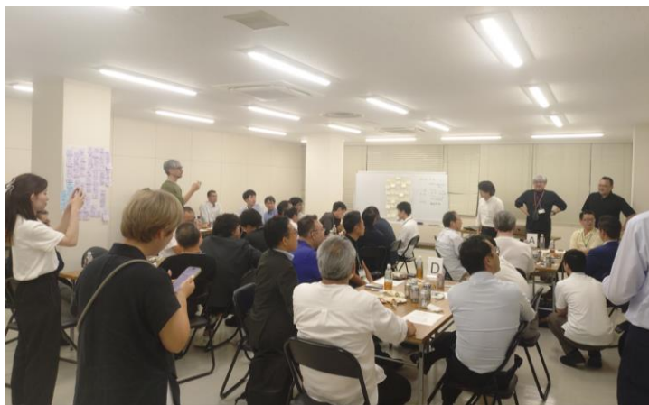
若手組合員等による議論の様子