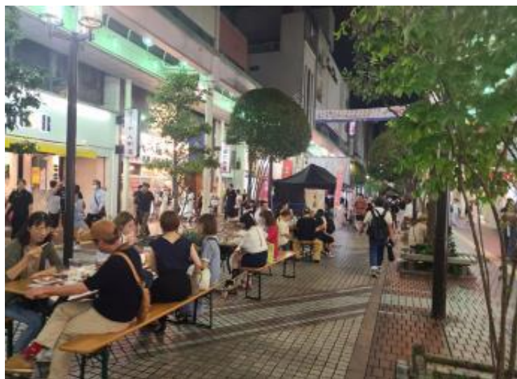
「Bang BAR SENDAI」開催の様子