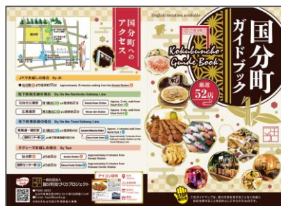
令和6年度に作成した 国分町ガイドマップ