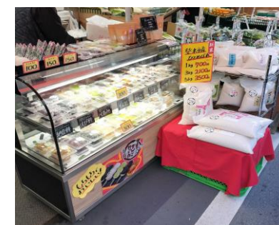
令和7年度に店舗改善を行った事例