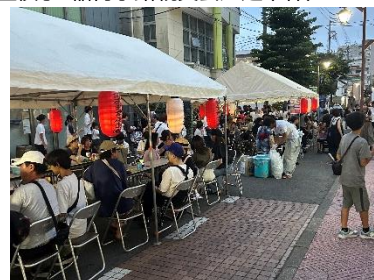
河原町マルシェ「夏まつり&夜市」 (河原町商店街振興組合・チャレンジ枠)