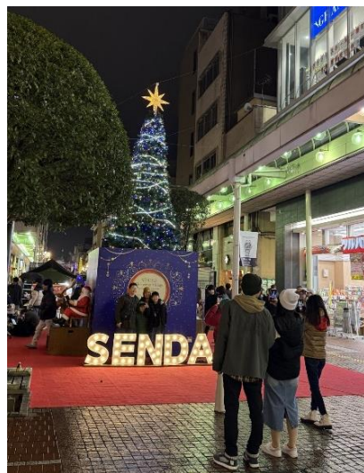
「SENDAI Christmas Village by Bang BAR SENDAI」で設置されたイルミネーションツリー