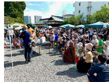
「8724子まもりプロジェクト」夏祭りイベント (柳生・西中田商工振興会/テーマ枠)