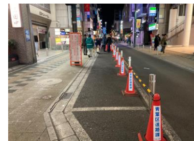
国分町二丁目の荷捌き帯有効活用に向けた社会実験の様子