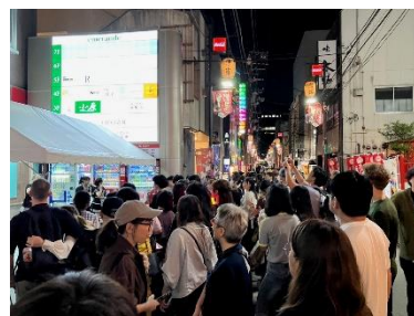
2025イナトラほろ酔い縁日 推しのアイドル・アーティスト・店長をみつけよう (虎屋横丁・稲荷小路親交会/通常枠)